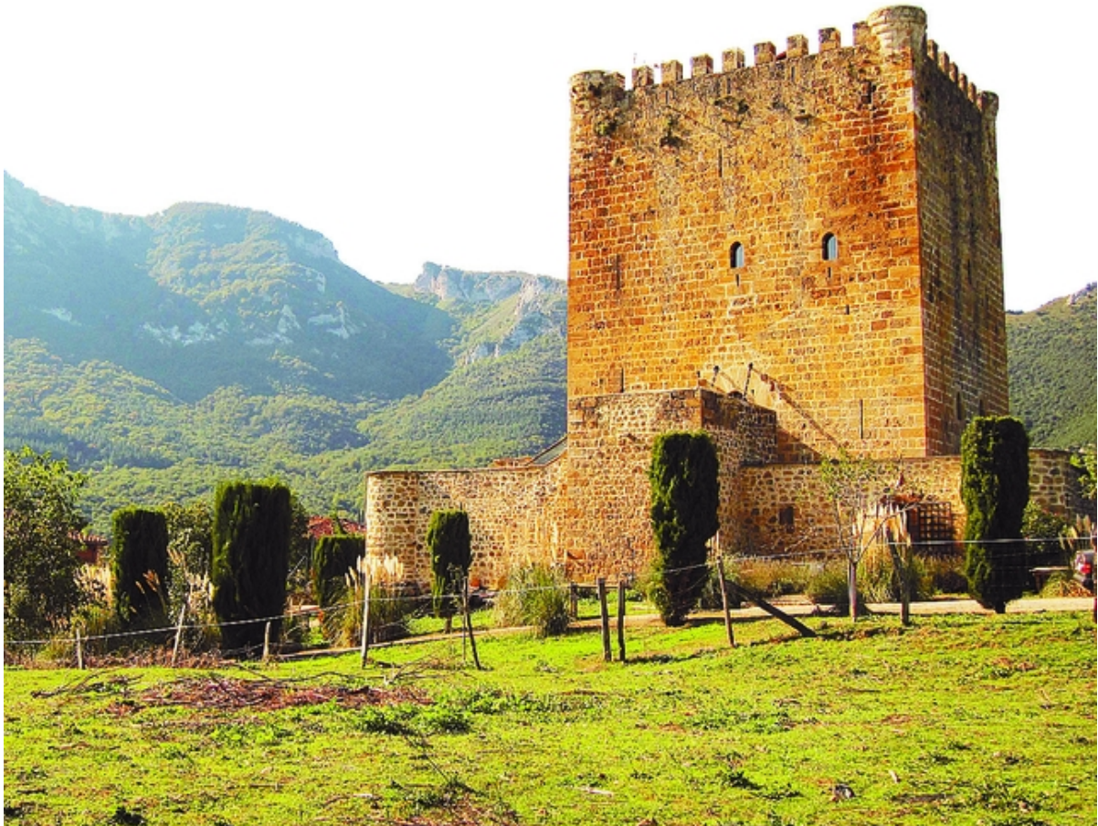
Castillo de Lezana de Mena.

Un príncipe austrohúngaro, con residencia en Alemania, rusos, estadounidenses, mejicanos, colombianos, chinos e incluso sociedades de inversión suizas y luxemburguesas han puesto sus ojos en esta magnífica construcción de 800 metros cuadrados del siglo XIV y una finca de 23.000 a su alrededor. Pretendientes no le faltan al castillo de Lezana, rodeado por los magníficos montes de la Peña y con vistas privilegiadas a una buena parte del verde Valle de Mena. Aunque de momento, ninguna operación ha prosperado.