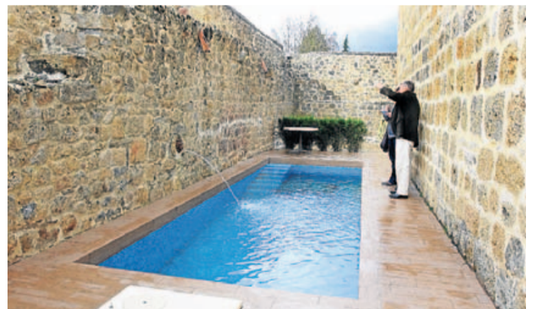
Piscina intramuros.

Cientes rusos, americanos y hasta un príncipe austrohúngaro